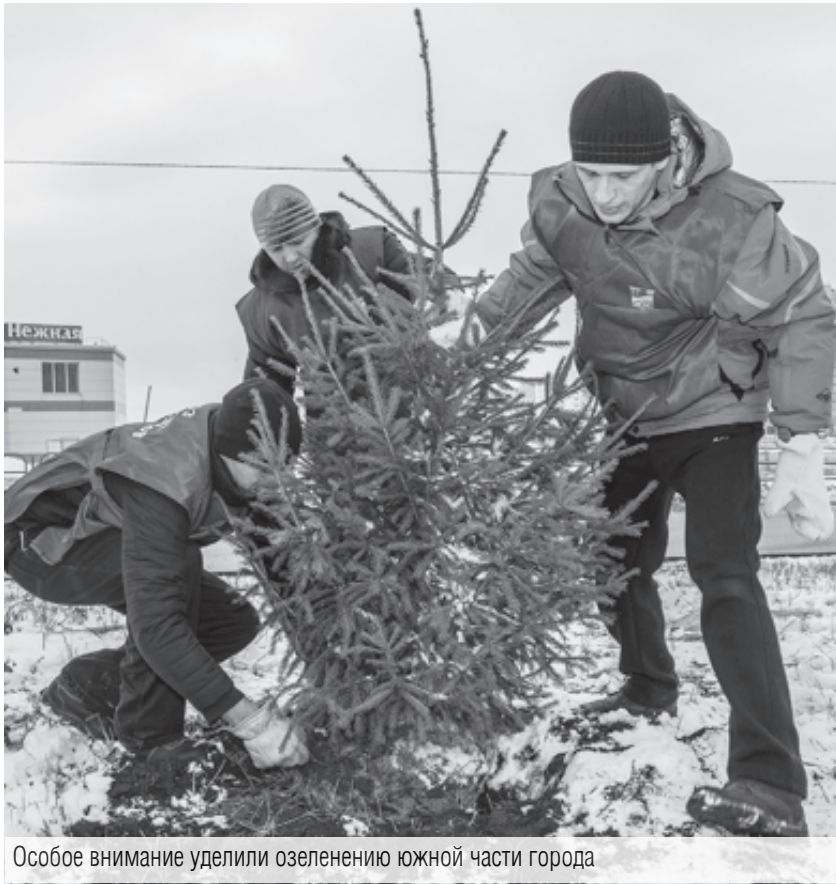
Особое внимание уделено озеленению южной части города

В 2017 году в Магнитке высажено деревьев и кустарников в три раза больше, чем запланировано