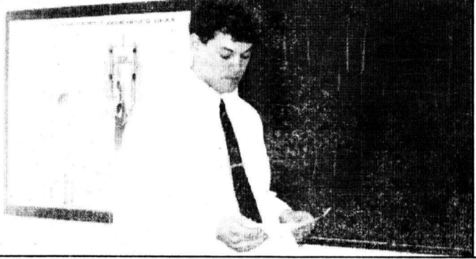
Теоретическая часть тоже важна.