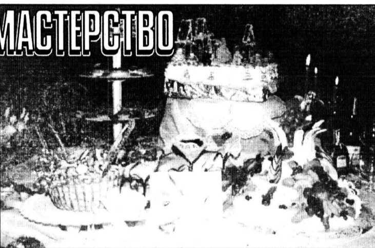
Что ни блюдо — то произведение искусства.

Как известно, из ничего женщина способна сотворить три вещи: шляпку, салатик и скандал. Правда, тот, кто придумал когда-то эту шутку, явно не имел в виду нашу женщину. Ибо заниматься шляпками ей было некогда во все времена. Ведь из «ничего» многие годы россиянкам приходилось творить не только салатик, но практически все семейное меню. Иначе скандал мог закатить вернувшийся с работы голодный муж.