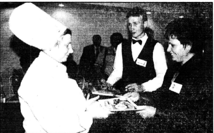
И приятный момент — награждение.