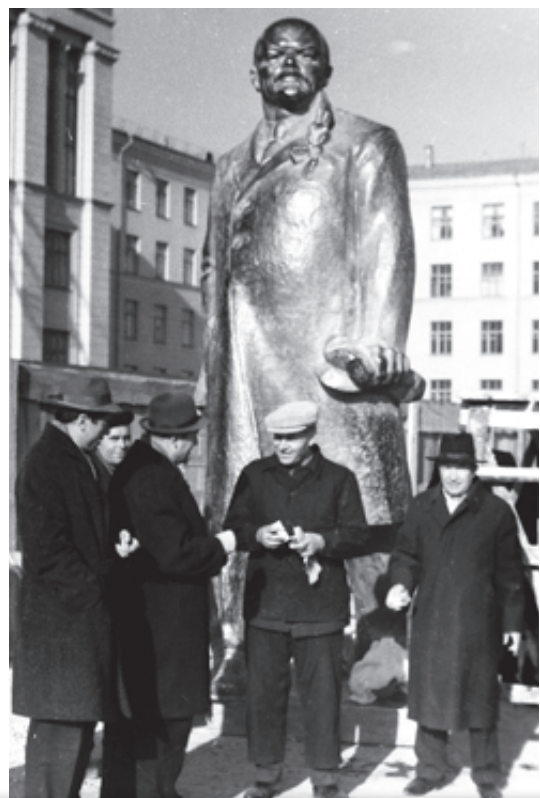
Установка памятника Ленину на проспекте Ленина. 1967 г.