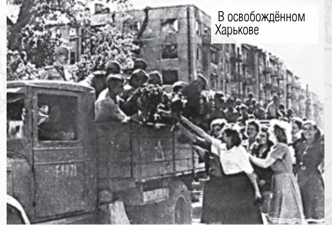
В освобождённом Харькове

Оккупация Харькова длилась 641 день. Только с четвёртой попытки город был окончательно освобождён. Были созданы условия для развития дальнейшего наступления и освобождения Левобережной Украины.