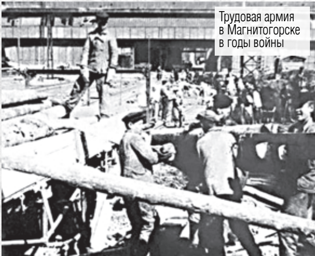
Трудовая армия в Магнитогорске в годы войны