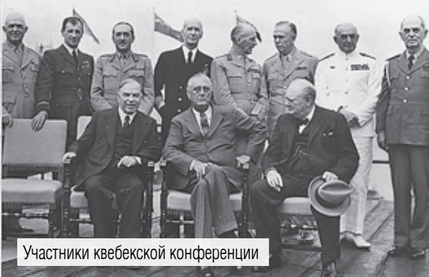
Участники квебекской конференции