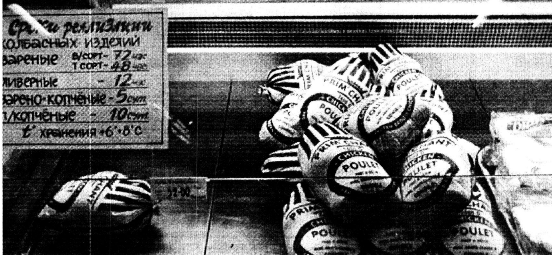
Витрина магазина «Зори Урала».

Список реализованных колбасных изделий Вареные - 72 руб Т. сорт - 48 руб Ливерные - 12 руб Копченые - 5 руб Хранения +6...8°С