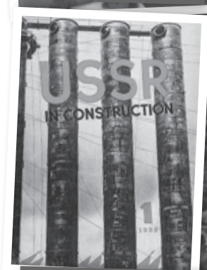
Номер журнала «СССР на стройке», посвященный Магнитострою