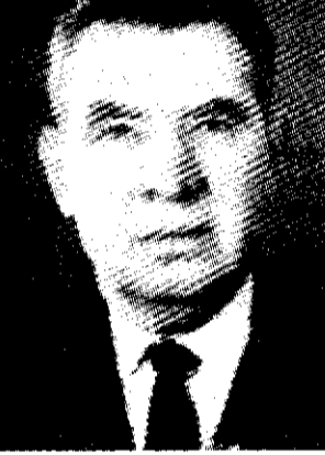
ДЕЛА И СУДЬБЫ ДИРЕКТОРОВ