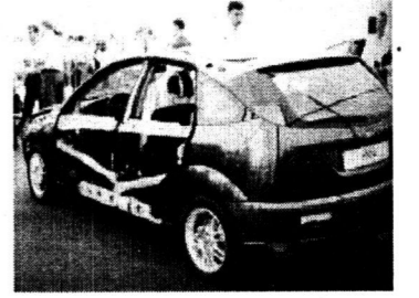
Патриотизм у прилавка