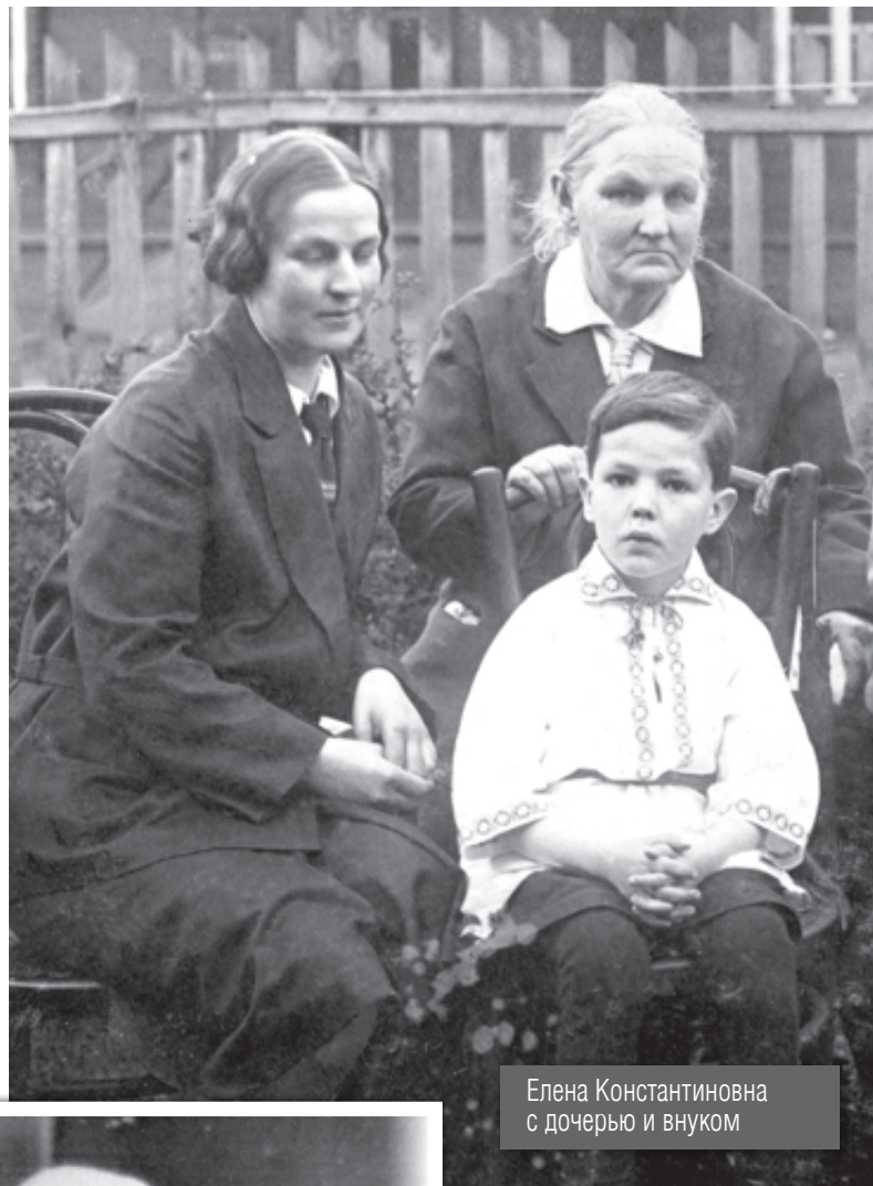
Елена Константиновна с дочерью и внуком