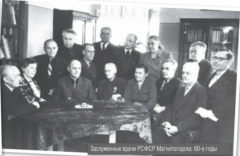
Заслуженные врачи РСФСР Магнитогорска. 60-е годы