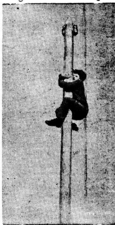
Фото и текст Н. Нестеренко.