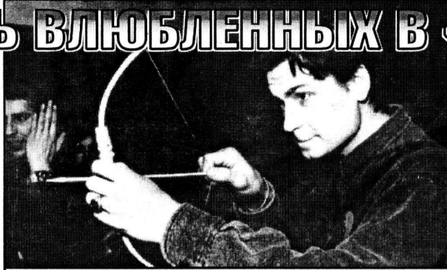
Куда полетит стрела Купидона?

— Их — громадье. Необходимы различные конкурсы, праздники как для пожилых, так и для молодежи. Будем приглашать с концертами различные профессиональные и самодеятельные коллективы. Первым к нам приедет ансамбль «Марьюшка». Сегодня и первая премьера: проводим праздник влюбленных — День святого Валентина. Постара-