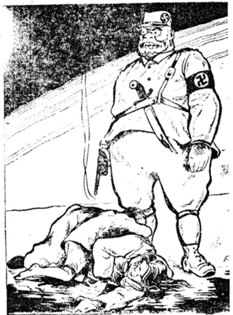
Фашистские палачи Германии готовят новую мировую войну

В. Штумпер. Физическая химия процесса образования накипи в котлах и его предупреждение.