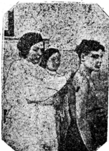
На медпункте делают прививку против брюшного тифа

И каждая из них отзывается о фильме восторженно. ГРЕМИН.