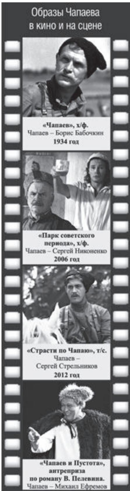
Образы Чапаева в кино и на сцене

За минувшие 95 лет история Чапаева и его гибели обросла немислимыми слухами и домыслами, так что Чапаев по-прежнему остаётся легендой, которая ещё долгое время будет очень привлекательной для исследователей ☺