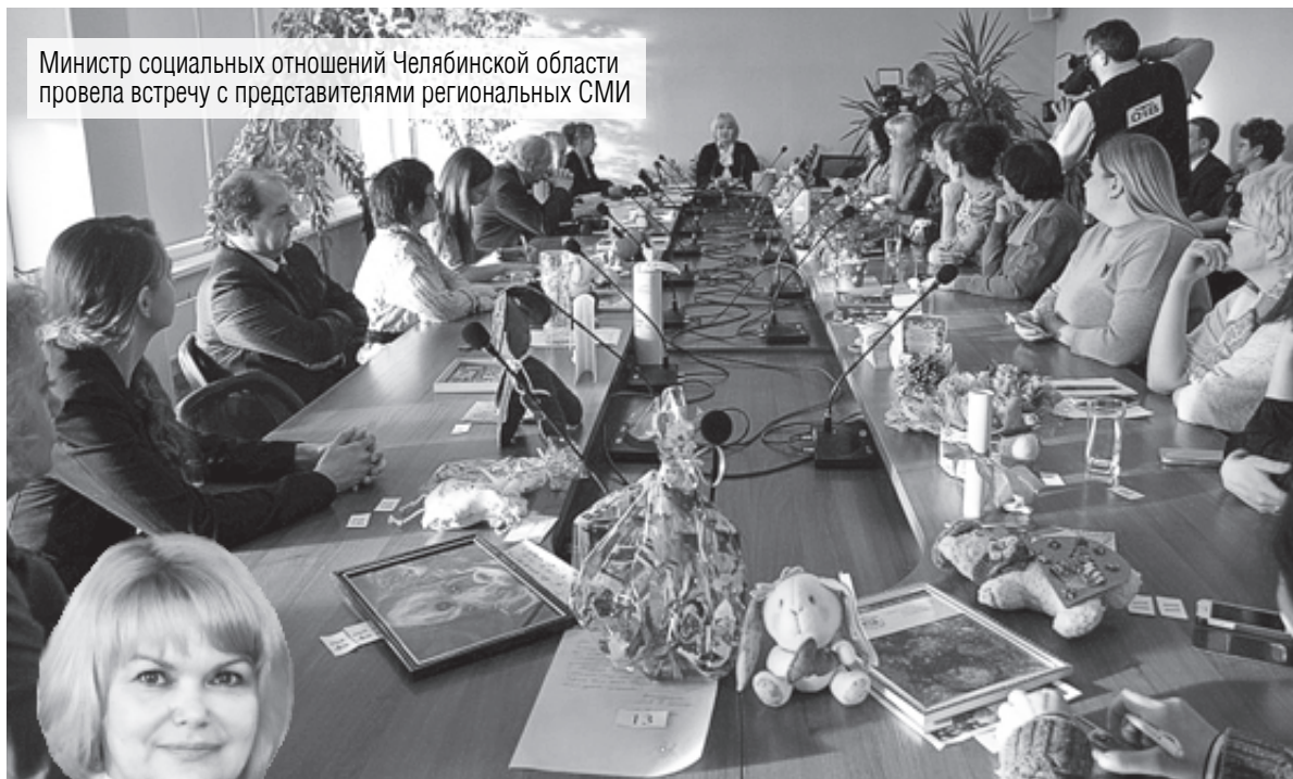
Министр социальных отношений Челябинской области провела встречу с представителями региональных СМИ

Более миллиона южноуральцев пользуются мерами соцподдержки