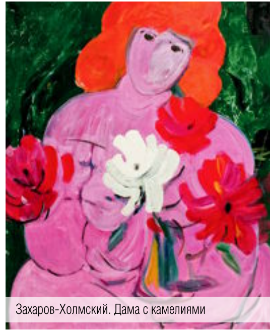
Захаров-Холмский. Дама с камелиями

В эти годы он создаёт иллюстрацию к калмыцкому героическому эпосу «Джангар».