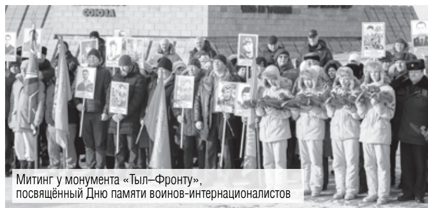
Митинг у монумента «Тыл–Фронту», посвящённый Дню памяти воинов-интернационалистов