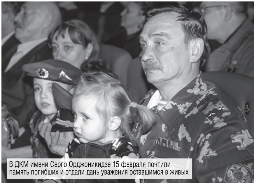
В ДКМ имени Серго Орджоникидзе 15 февраля почтили память погибших и отдали дань уважения оставшимся в живых

– Мы помним и о других боевых точках, где наши ребята сражались и отда-