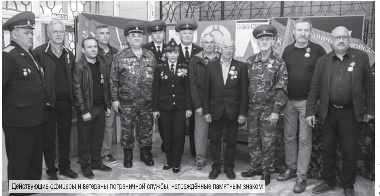
Действующие офицеры и ветераны пограничной службы, награждённые памятным знаком

В преддверии векового юбилея пограничных войск ФСБ России в Магнитогорске проходит череда торжеств