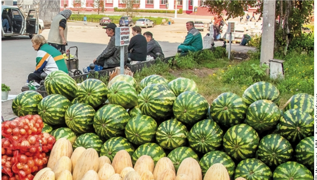
Андрей Серебряков