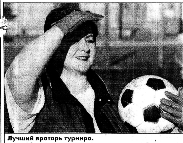
Лучший вратарь турнира.