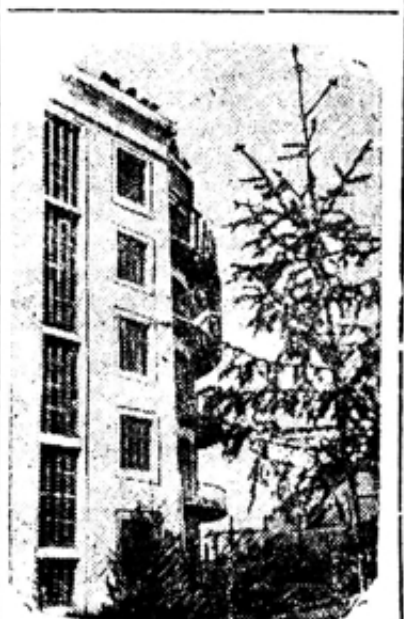
Вид на заводоуправление

Накомфин СССР решил провести первый тираж третьего выпуска «Займа второй пятилетки» с первого по четвертое июня 1936 года в Смоленске. (ТАСС).