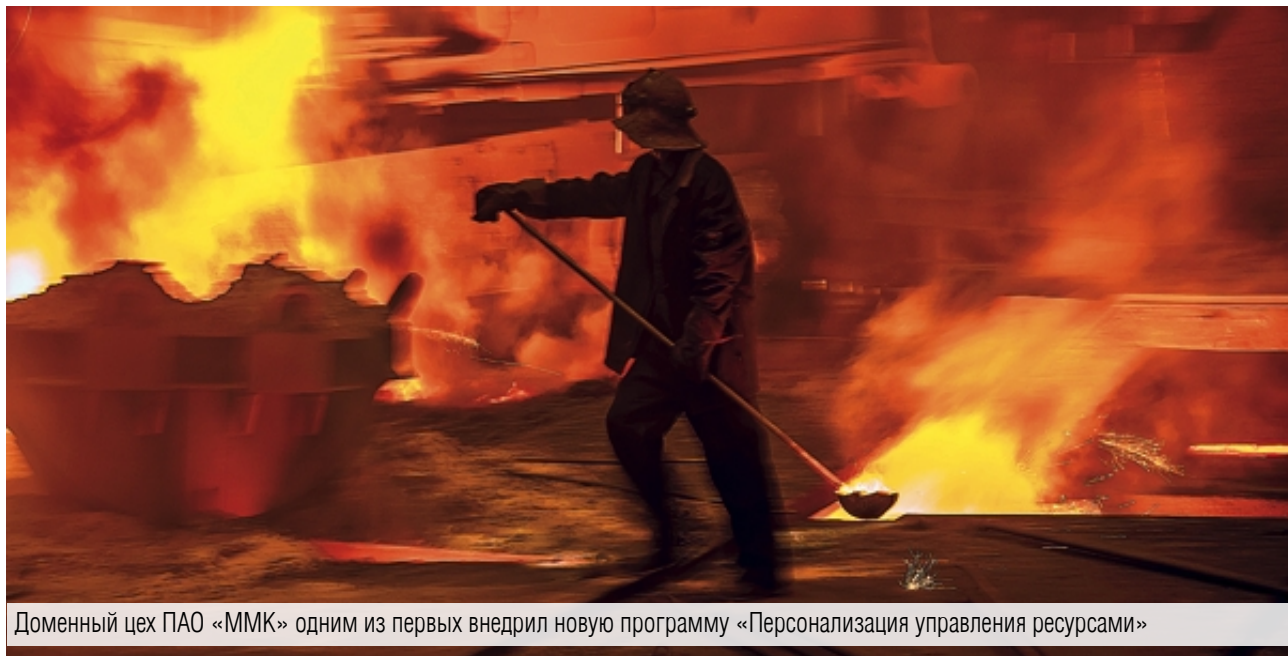
Доменный цех ПАО «ММК» одним из первых внедрил новую программу «Персонализация управления ресурсами»

В доменном цехе ПАО «ММК» успешно реализуется стратегическая инициатива по вовлечению работников в процесс управления ресурсами