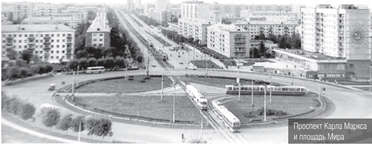
Проспект Карла Маркса и площадь Мира

В названиях городов, проспектов, улиц сконцентрирована память поколений