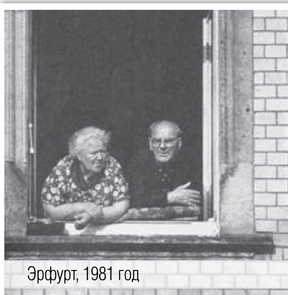
Эрфурт, 1981 год