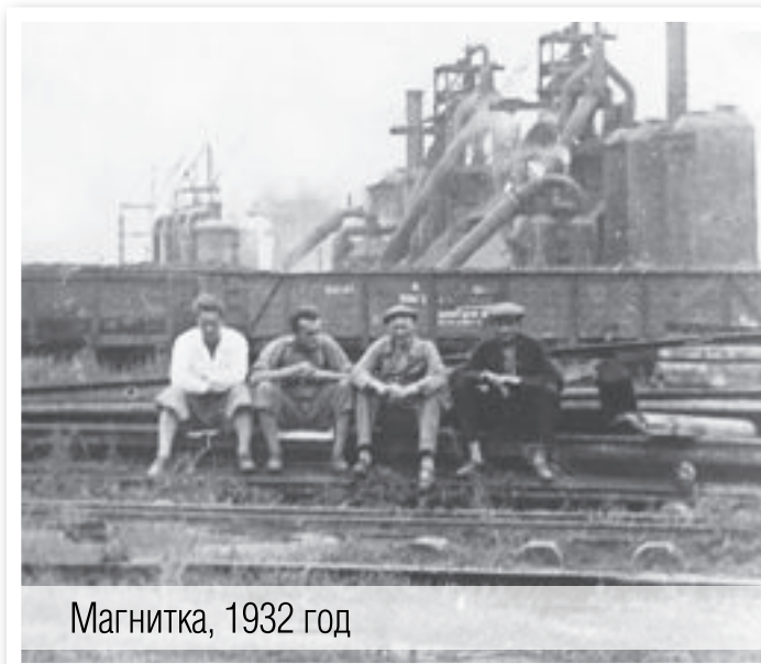
Магнитка, 1932 год