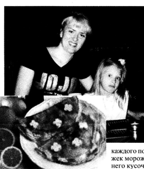
«Блинчики с сюрпризом»