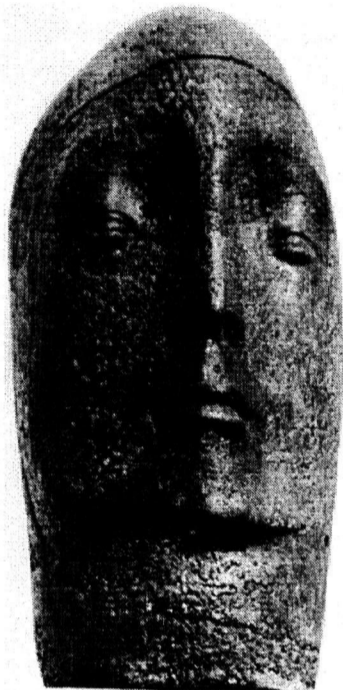
31 мая исполнилось бы 60 лет художнику Виктору Николаевичу Антонову.

Сколько таких и разных других рубежей у каждого человека! Все они как-то отмечаются, привлекают внимание как самого виновника события, так и окружающих людей. Традиционно это — как дань таинству рождения человека, его бытия. Праздник дня рождения остается формальным отсчетом времени, окрашенным иногда значительными моментами возрастного характера: первыми словами, первыми знаниями, этапами взросления. Более осознанно позволяет обратиться к такому событию след человека, всегда уникальный и неповторимый, как неповторима его судьба — инструмент постижения тайны, которую он несет в себе.