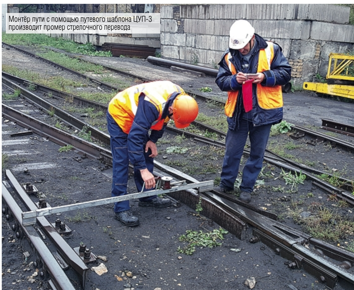
Монтер пути с помощью путевого шаблона ЦУП-3 производит промер стрелочного перевода