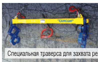
Специальная траверса для захвата рельса