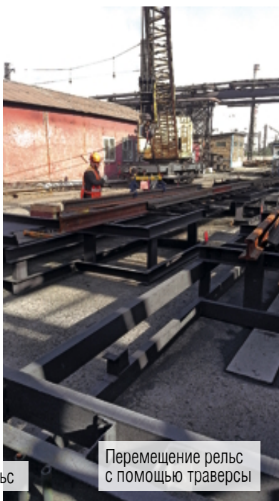
Перемещение рельса с помощью траверсы