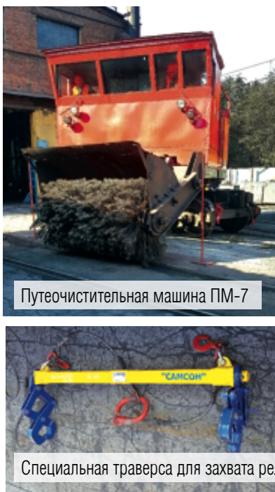
Путеочистительная машина ПМ-7