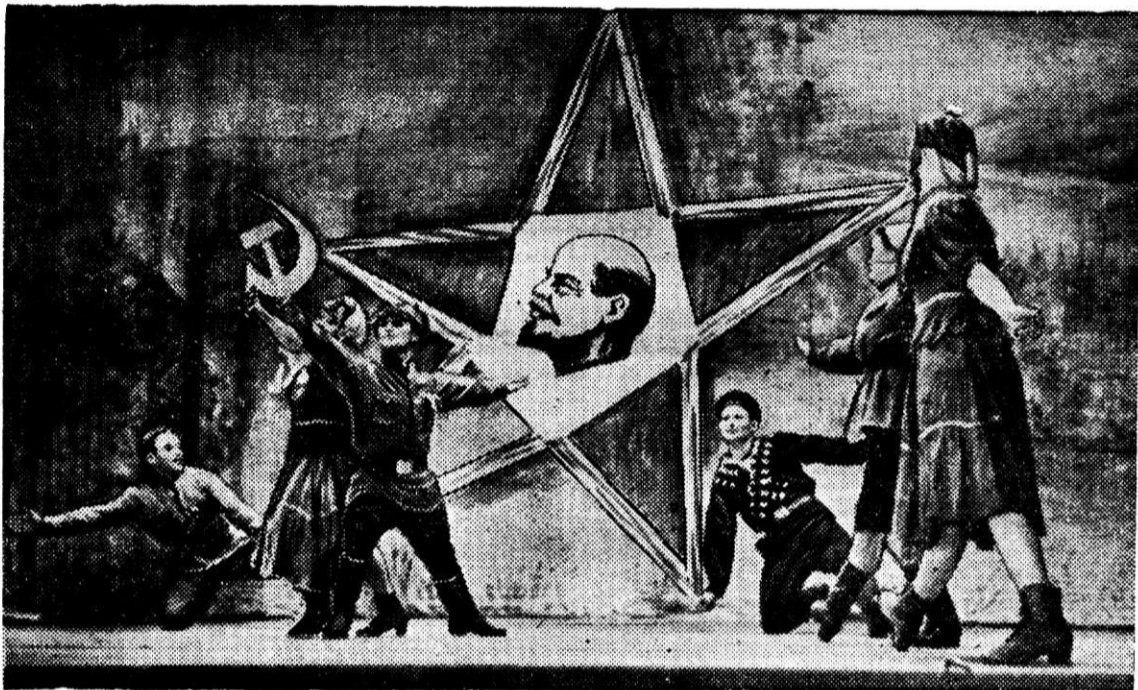
НА СНИМКЕ: финал из танцевальной сюиты «Смело мы в бой пойдем» в исполнении танцевального коллектива второго мартевского цеха.