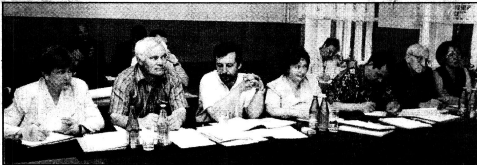
Государственная аттестационная комиссия.

В понедельник, 26 июня, в центре подготовки кадров «Персонал» состоялась защита дипломных проектов слушателей курсов, готовящих специалистов по связям с общественностью.