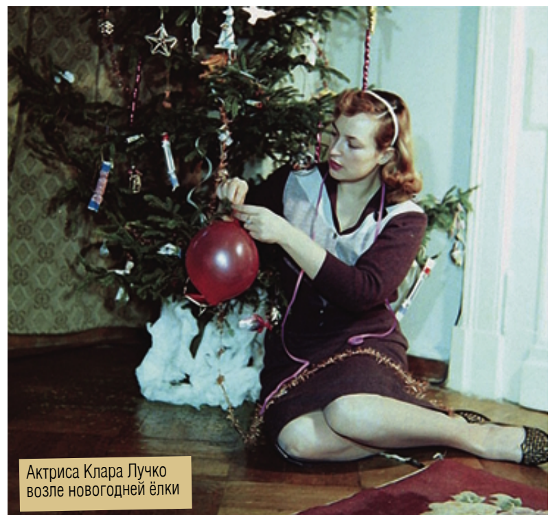
Актриса Клара Лучко возле новогодней ёлки

После этой публикации ёлка, на которую был наложен строжайший запрет, вдруг была не только разрешена, но и настоятельно рекомендована. Если главная газета страны выступает за организацию ёлок в детских учреждениях, то на языке тех лет это означало приказ. За четыре дня до наступления Нового года в города было завезено огромное количество ёлок, для которых в срочном порядке изготавливали украшения. Их катастрофически не хватало, так как заводы давно прекратили выпуск новогодних игрушек и мишуры.