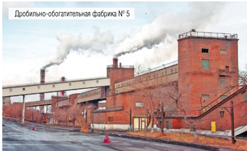
Дробильно-обогадательная фабрика № 5