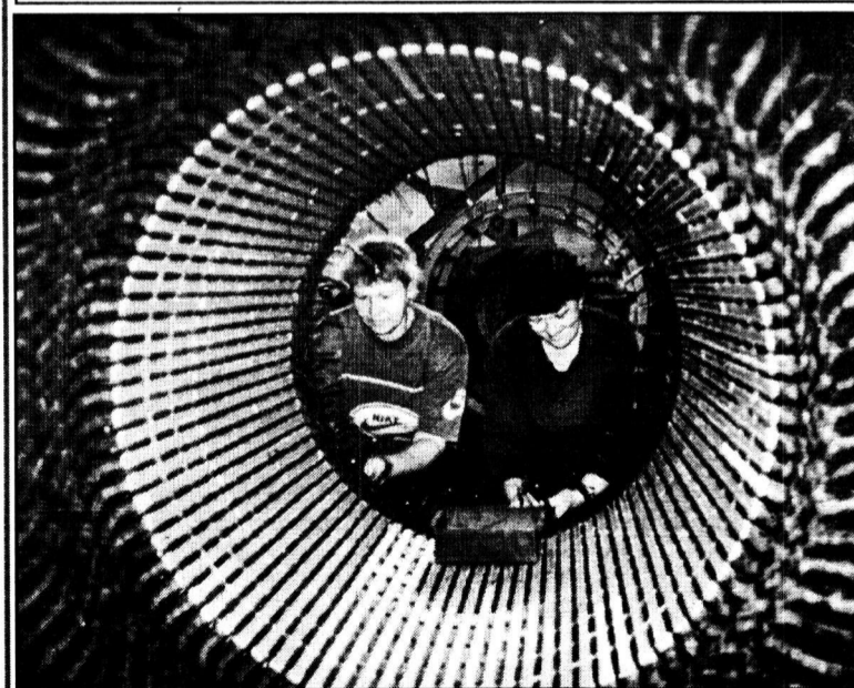
На ремонте электромашины.

Электроремонтный цех. Трудно представить технологическую цепочку ОАО «ММК» без этого подразделения. Именно здесь производят ремонт электромашин из различных цехов и производят металлургического комплекса. Специалисты цеха все заказы выполняют в срок и с высоким качеством.