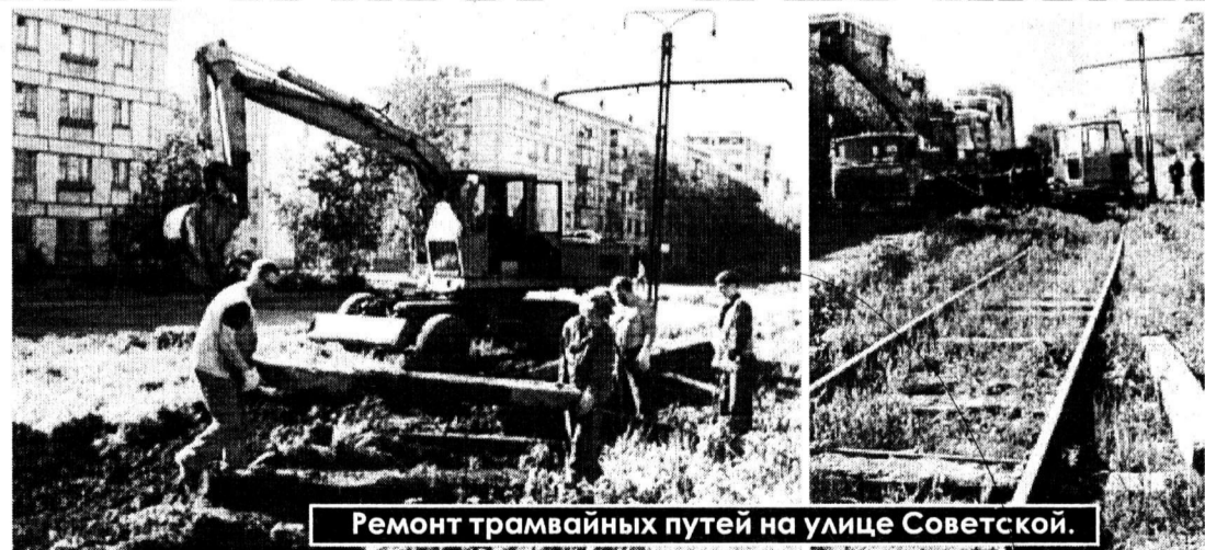
Ремонт трамвайных путей на улице Советской.

— Какие силы вы привлекли к ремонтным работам?