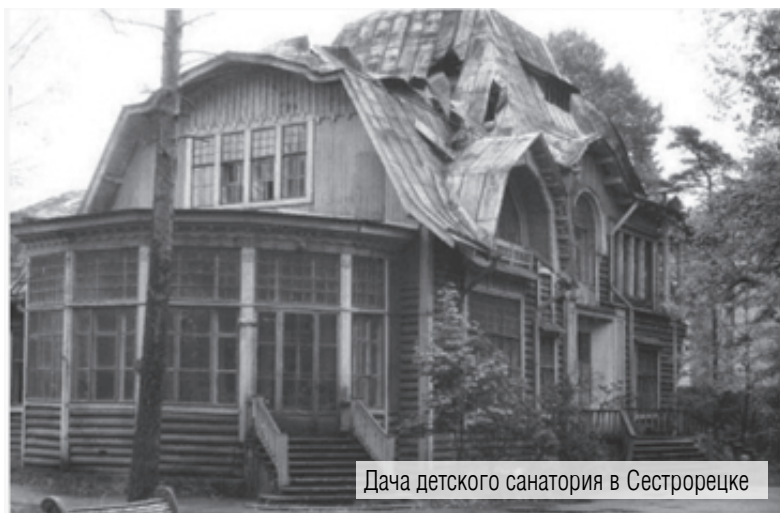
Дача детского санатория в Сестрорецке

Он хотел создать в Магнитогорске детские лагеря-городки, где ребята проводили бы время интересно и с пользой