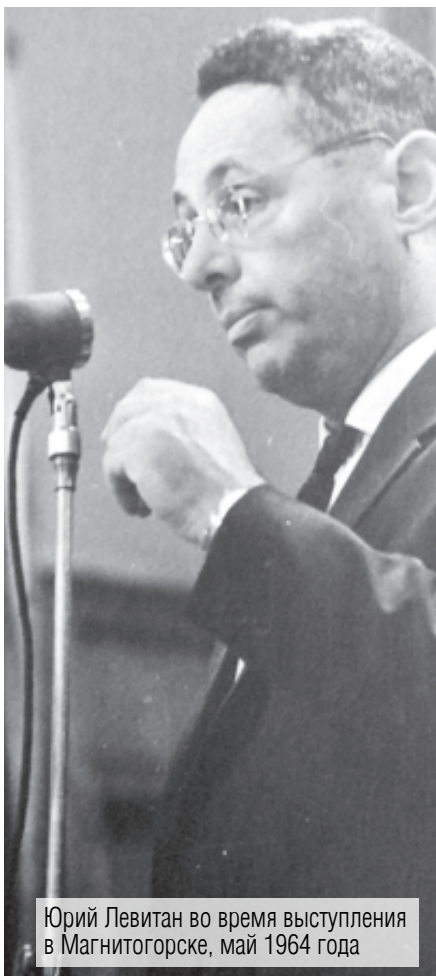
Юрий Левитан во время выступления в Магнитогорске, май 1964 года

Знаменитый диктор советского радио Юрий Левитан был восхищён активностью магнитогорской публики и мастерством местных швейников.