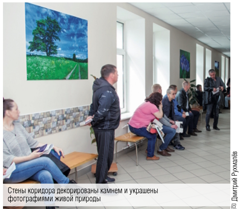
Стены коридора декорированы камнем и украшены фотографиями живой природы