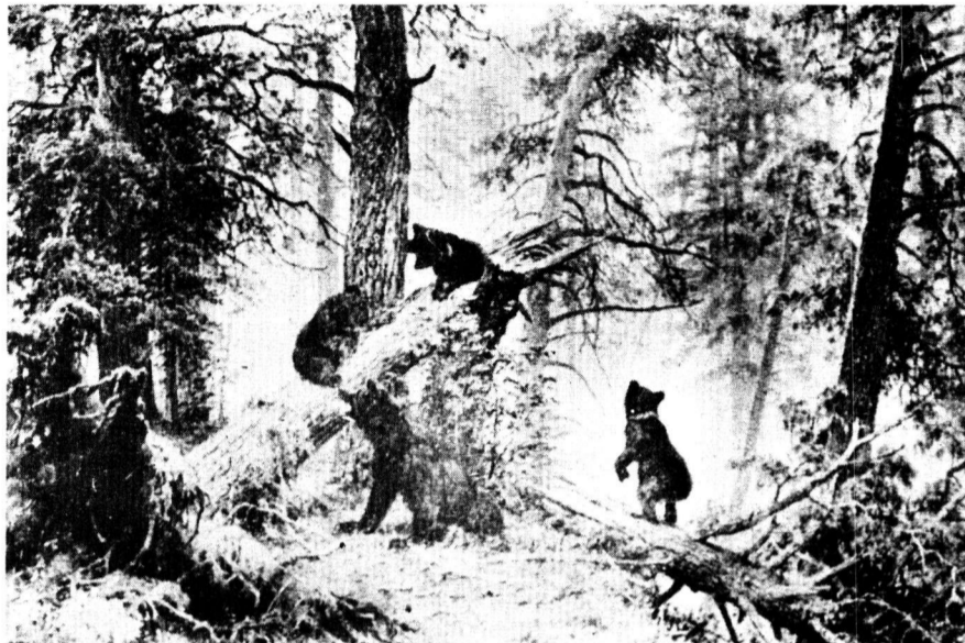
И. И. Шишкин. Утро в сосновом лесу. 1889 г. Государственная Третьяковская галерея.

Ну какая же загородная резиденция могла обойтись когда-нибудь без своей картинной галереи? Вот и мы тоже решили создать ее. И собрать в этой коллекции знакомые и незнакомые вам полотна, судьба которых так или иначе заслуживает интереса. А начать мы решили с прекрасной картины Ивана Ивановича Шишкина, знакомой-презнакомой каждому с глубокого детства, — «Утро в сосновом лесу». В народе, правда, ее чаще называют просто «Мишки». И при всей знакомости и доступности этого произведения мало кто уже помнит, что идею создания забавной сценки в утреннем лесу поддал Шишкину другой замечательный художник — Константин Аполлонович Савицкий. Он же, между прочим, нарисовал и медведей, поскольку в изображении животных Иван Иванович был меньшим виртуозом, чем в изображении деревьев и трав. Медведи настолько удались, что Савицкий не без удовольствия поставил в углу полотна и свою подпись. Однако купивший «Утро в сосновом лесу» для своей общедоступной галереи Павел Михайлович Третьяков настоял позже на ее снятии, приписав весь успех полотна таланту одного Шишкина. Не стоит сегодня судить о справедливости или несправедливости такого решения.