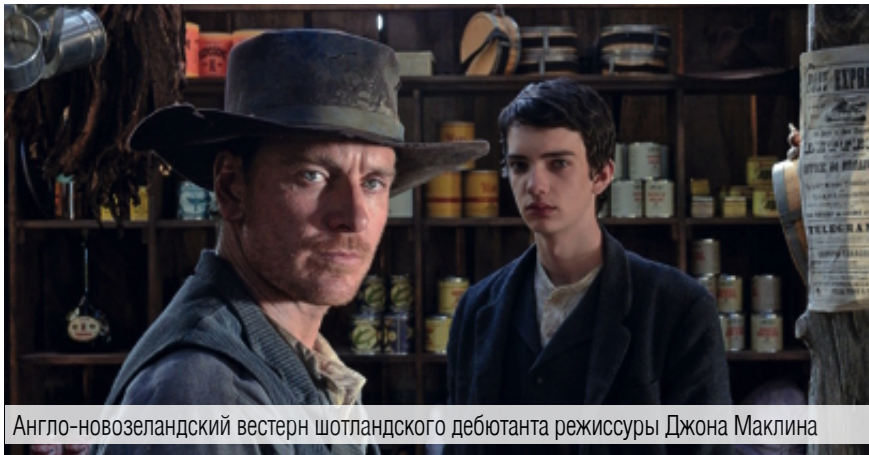
Англо-новозеландский вестерн шотландского дебютанта режиссуры Джона Маклина

Ого, даже кино клубу P. S. не чужд авантюризм. Чем ещё можно объяснить интерес клубных завсегдатаев к фильму «Строго на Запад» (18+), который киномены завтра посмотрят и обсудят в кинотеатре с джазовой душой?