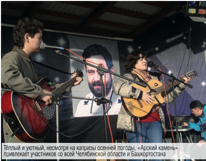
Тёплый и уютный, несмотря на капризы осенней погоды, «Арский камень» привлекает участников со всей Челябинской области и Башкортостана

«Арский камень» – музыкальный праздник с разножанровой программой