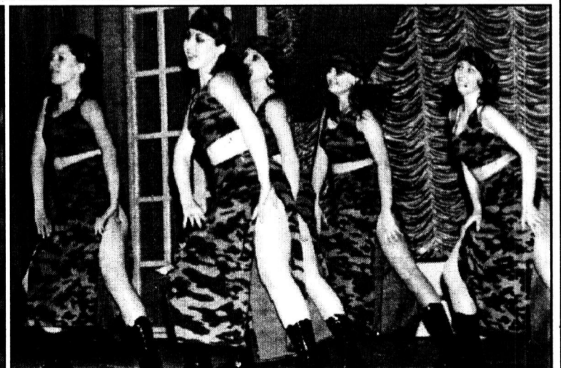
Танцгруппа локомотивного цеха ЖДТ.