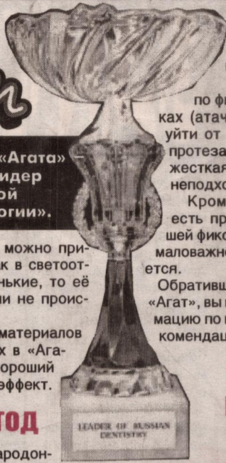
LEADER OF RUSSIAN DENTISTRY

Награда «Агата» Кубок «Лидер российской стоматологии».