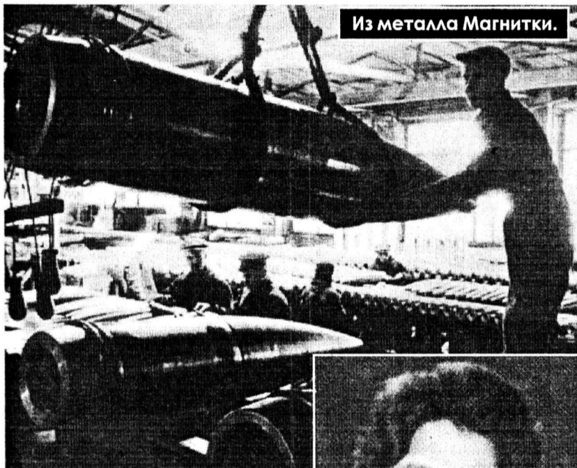
Из металла Магнитки.