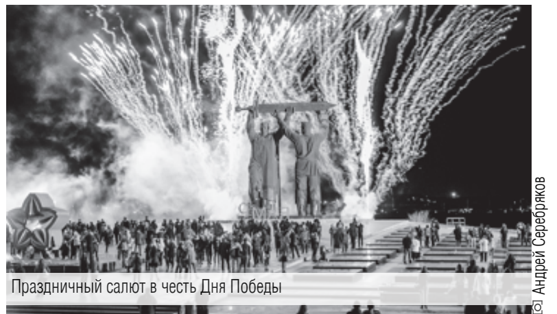
Праздничный салют в честь Дня Победы