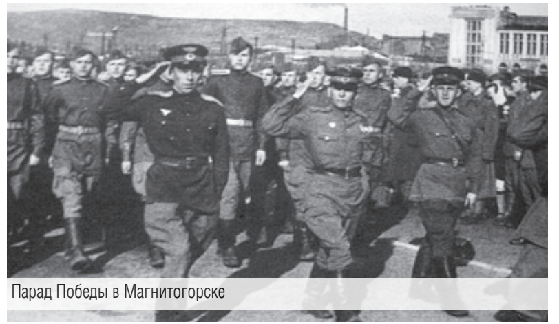
Парад Победы в Магнитогорске

Но песня не только не заняла призового места на конкурсе, но и подверглась жёсткой критике со стороны маститых поэтов и композиторов. К фронтовику Харитонову вопросов не было, а вот по Тухманову «прошлись» основательно. По их мнению, Тухманов, которому на тот момент было 35 лет, был слишком молод, чтобы писать произведения государственного масштаба, а кроме того, работал в жанре «лёгкой музыки» и по определению не мог быть автором культовой советской песни. Более того, они усмотрели в песне элементы западной музыки, не то танго, не то фокстрота. Не устраивали и современные методы оркестровки, например, использование бас-гитары. Тогдашний председатель правления Союза композиторов РСФСР Родион Щедрин считал, что нельзя петь о Победе под «такую» музыку. Но, несмотря на столь критическое начало, судьба песни сложилась более чем удачно. На одном из «Голубых огоньков» её исполнил Леонид Сметанников. Затем в ноябре 1975 года Лев Лещенко с хором МВД спел «День Победы» в прямом эфире. Обойти цензуру