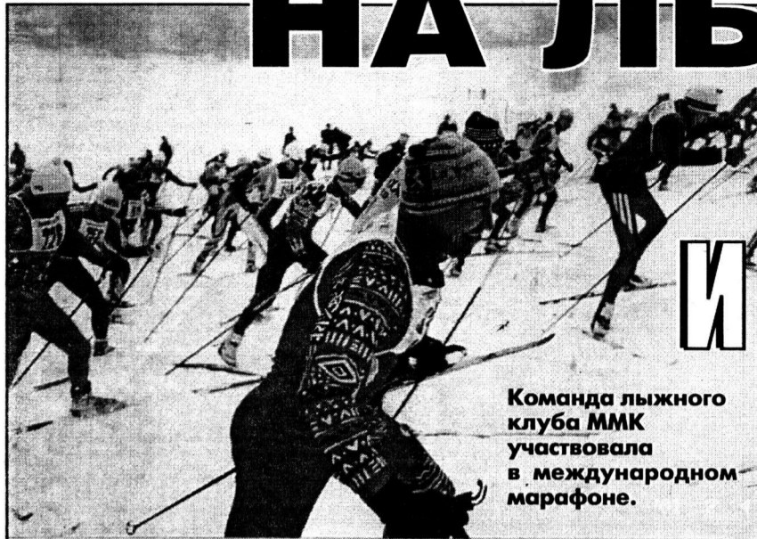
Команда лыжного клуба ММК участвовала в международном марафоне.