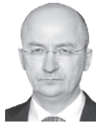
Олег Цепкин, член Совета Федерации ФС РФ

Уважаемые южноуральцы! Примите поздравления с Днём Конституции России!