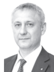
Сергей Бердников, глава Магнитогорска

Уважаемые магнитогорцы! Поздравляю вас с Днём Конституции Российской Федерации!