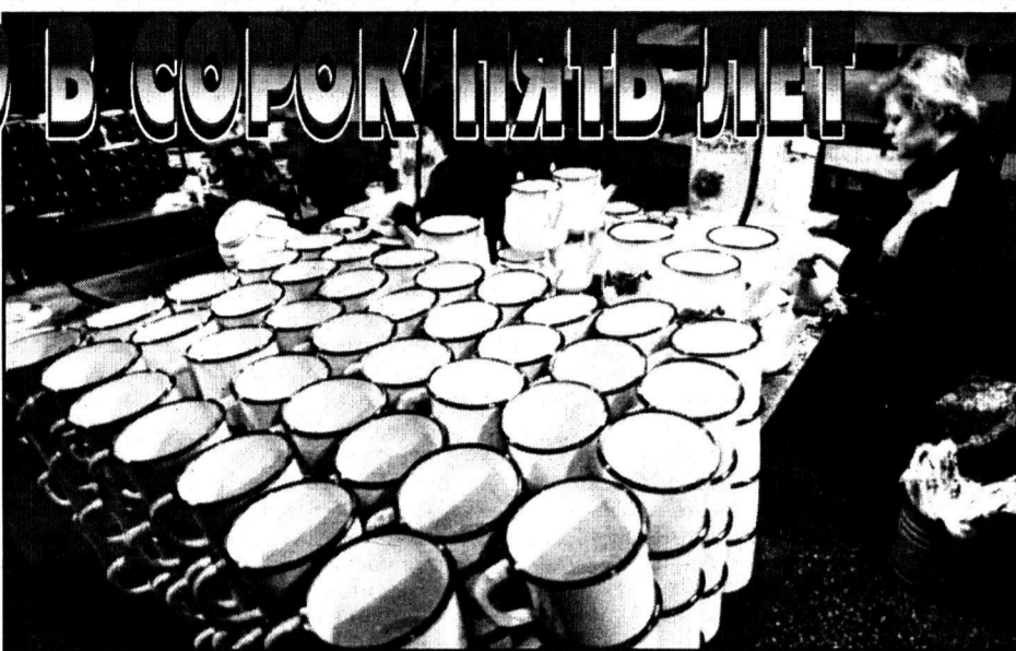
Продукция ЗАО «Эмаль».