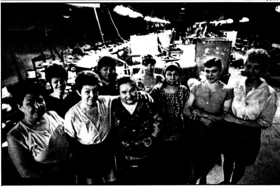
Лучшее звено участка эмалирования.