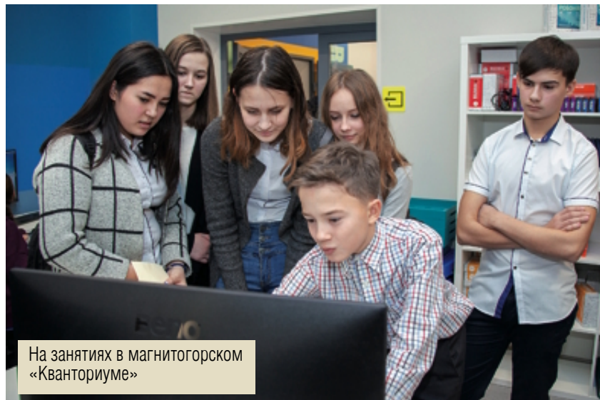
На занятиях в магнитогорском «Кванториуме»