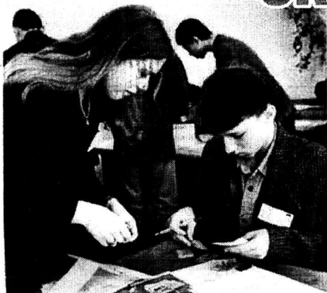
Пять лет на работает в Магнитогорске негосударственное учреждение дополнительного образования «ЭКО».

Впервые в этом году «ЭКО» принимает участие во всероссийском конкурсе, который проводит ассоциация негосударственных образовательных учреждений (АСНОУ) при поддержке института «Открытое общество» (Фонд Сороса).