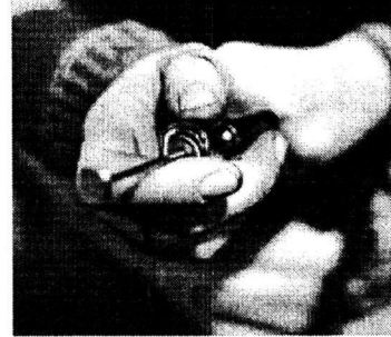
семи лет воздержания вновь вернулся к наркотикам, но уже с удвоившейся тягой.

— Знаю троих парней, которые прошли там курс лечения и вроде бы выздоровели, — рассказывает Н.Н. Одокиенко. — Спустя время находим в квартире одного из них наркотики, другой изо дня в день тусуется с приятелем-наркоманом. Скажу больше: я видел человека, который после