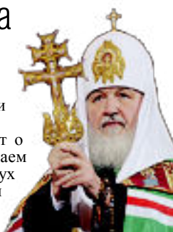
Кирилл, Патриарх Московский и всея Руси

Пусть благодать Господа Иисуса Христа пребывает с вами, вдохновляет на созидательные труды, помогает проявлять деятельную заботу о ближних и творить добрые дела.