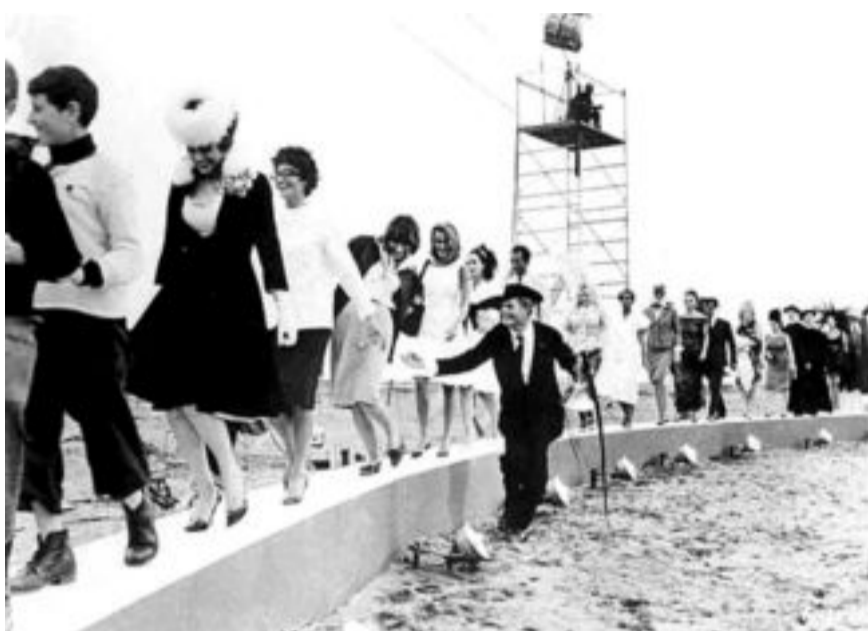
«Восемь с половиной» Федерико Феллини потянул на 14 бобин

Создали сообщество в социальной сети «В.Контакте»: сообщают расписание сеансов, пишут о фильме, количестве бобин и метров пленки. Например, «Восемь с