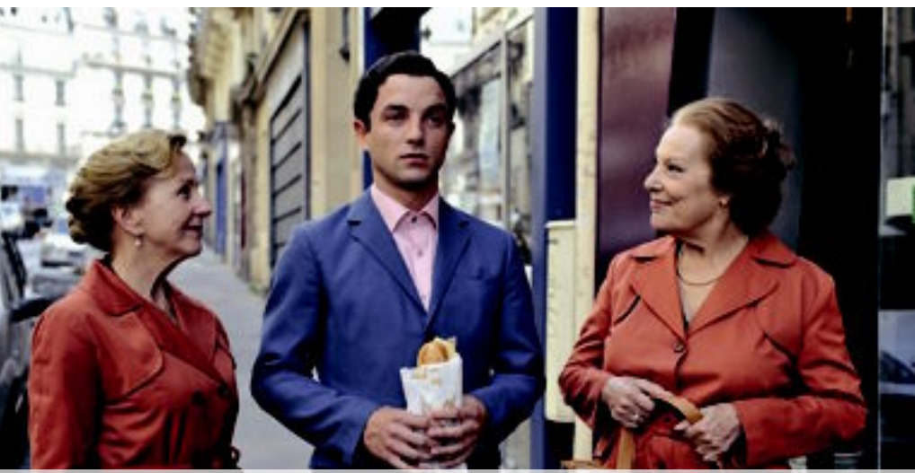
Кадр из фильма «Мой Аттила Марсель»

пахнутыми глазами — в фильме сыграл две роли, да так, что не сразу угадываешь в них одного исполнителя. Тридцатилетний Гуи известен и как режиссёр: его короткометражка «Алексис Иванович, вы мой герой» (16+) получила приз в Каннах. Его мечта — снять полный метр. При-