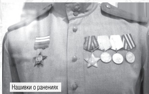
Нашивки о ранениях

• Постановлением ГКО в армии введены отличительные нагрудные знаки ранения в виде нашивок прямоугольной формы из галуна: тёмно-красного при лёгком ранении, золотистого – при тяжёлом. Носятся справа над орденами и медалями.